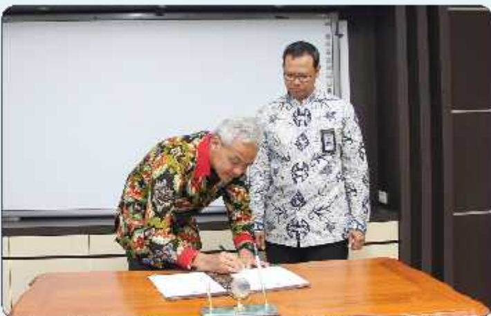
Gubernur Jateng Ganjar Pranowo menandatangani BAST penyerahan LK unaudit TA 2018 disaksikan Kapan BPK Provinsi Jateng Ayub Amali (28/3)