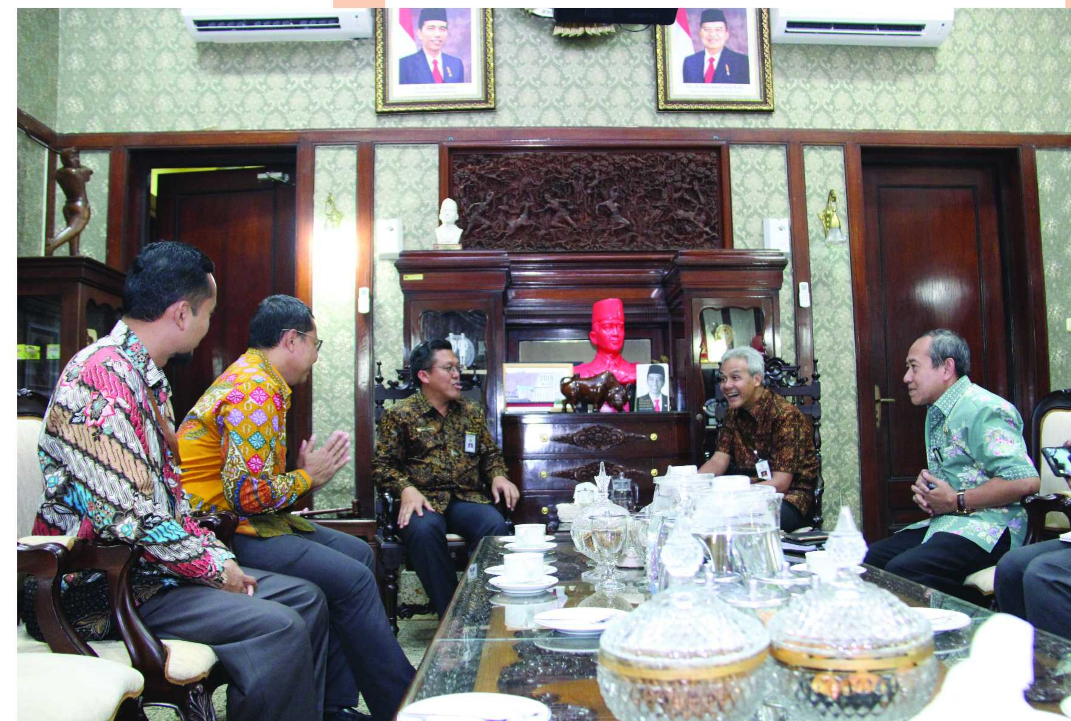
Kepala Badan Pendidikan dan Pelatihan Pemeriksaan Keuangan Negara (Badiklat PKN) BPK RI, di Jakarta