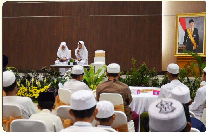
Pembacaan ayat suci Al-Qur'an dan saritilawah oleh anak panti asuhan peserta buka bersama di Kantor BPK Perwakilan Provinsi Jateng, Selasa (28/05).