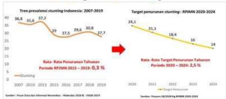
Gambar 1. Trend dan Target Penurunan Stunting

Prevalensi Stunting dari tahun ke tahun cenderung fluktuatif, meningkat pada periode 2007-2013, kemudian menurun pada periode 2014-2016, dan mengalami kenaikan kembali pada periode 2017-2018, kemudian dalam laporan SSGBI pada tahun 2019 kembali menurun pada angka 27,7 % (Kementerian Kesehatan, 2020). Namun demikian disparitas yang lebar antar provinsi serta rata-rata penurunan yang relatif lambat merupakan tantangan dalam kerangka percepatan penurunan Stunting menjadi 14 % pada tahun 2024. Pada tahun 2019, terdapat 13 (tiga belas) provinsi yang masuk dalam kategori sangat tinggi ( \geq 30\% ), 17 (tujuh belas) provinsi kategori tinggi ( 20 < 30\% ) dan 4 (empat) provinsi kategori medium ( 10 < 20\% ) (Gambar 1).